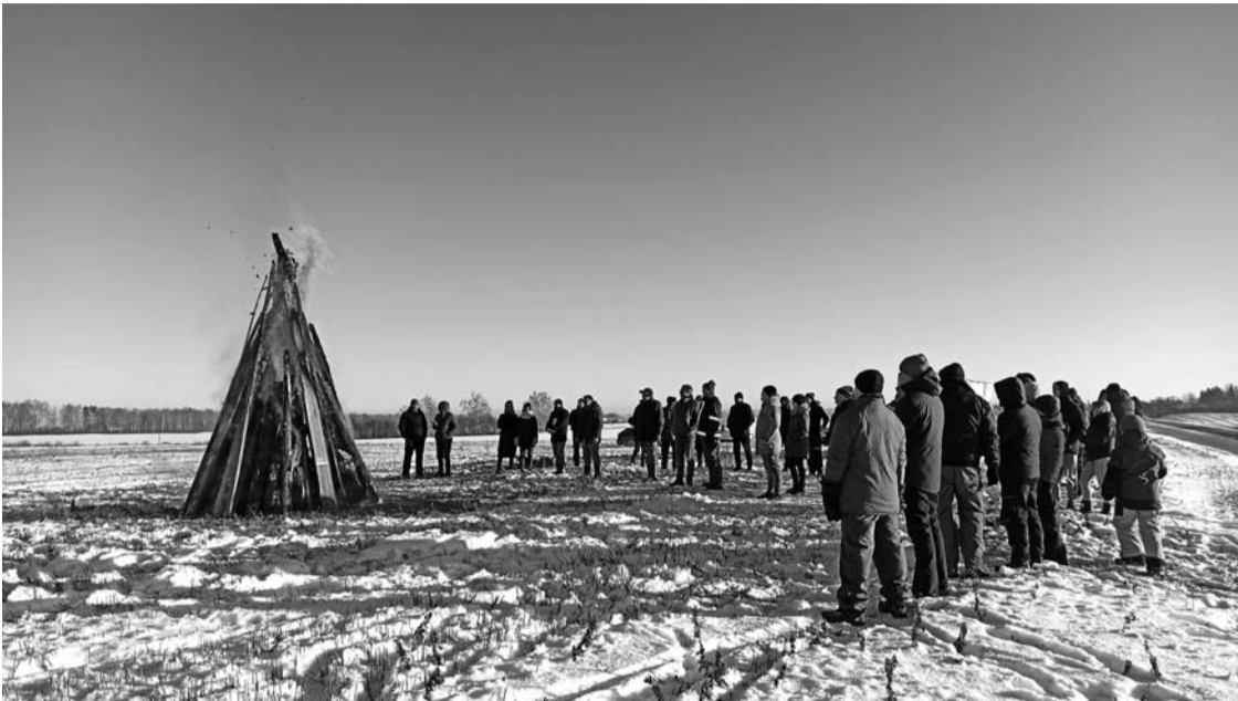
Pagojeje protesto laužų kūreno kelios dešimtys ūkininkų.