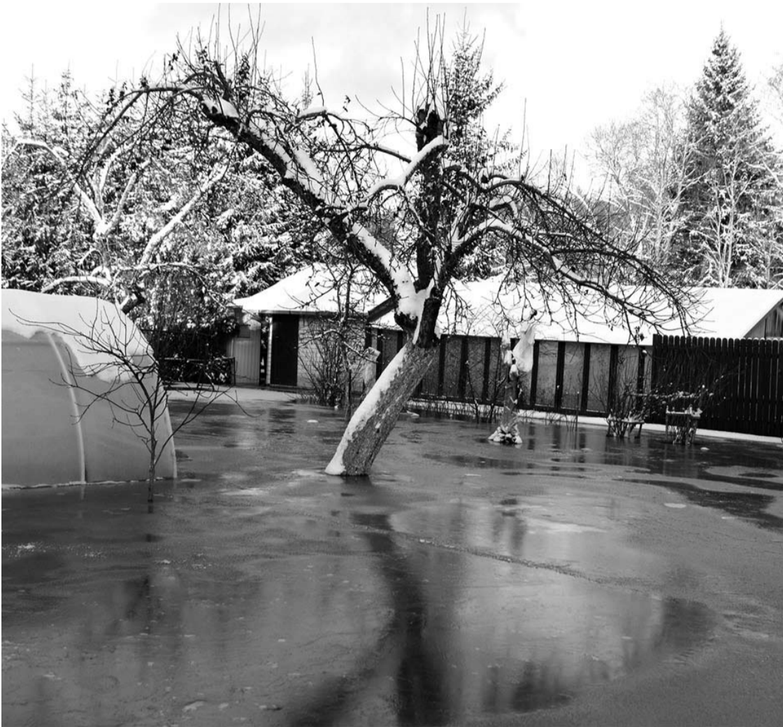
Vanduo „Elmos“ soduose sėmė šulinius, rūsius ir šiltnamius, vandenyje plaukiojo malkos, suoliukai.