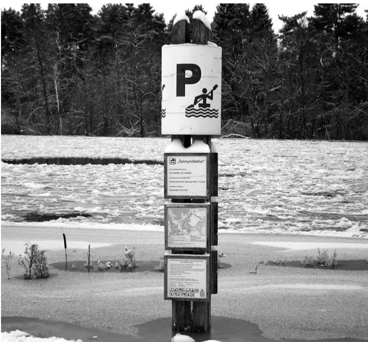
Baidarininkų stotelės „Šeimyniškėliai“ nuoroda atsidūrė po vandeniu.