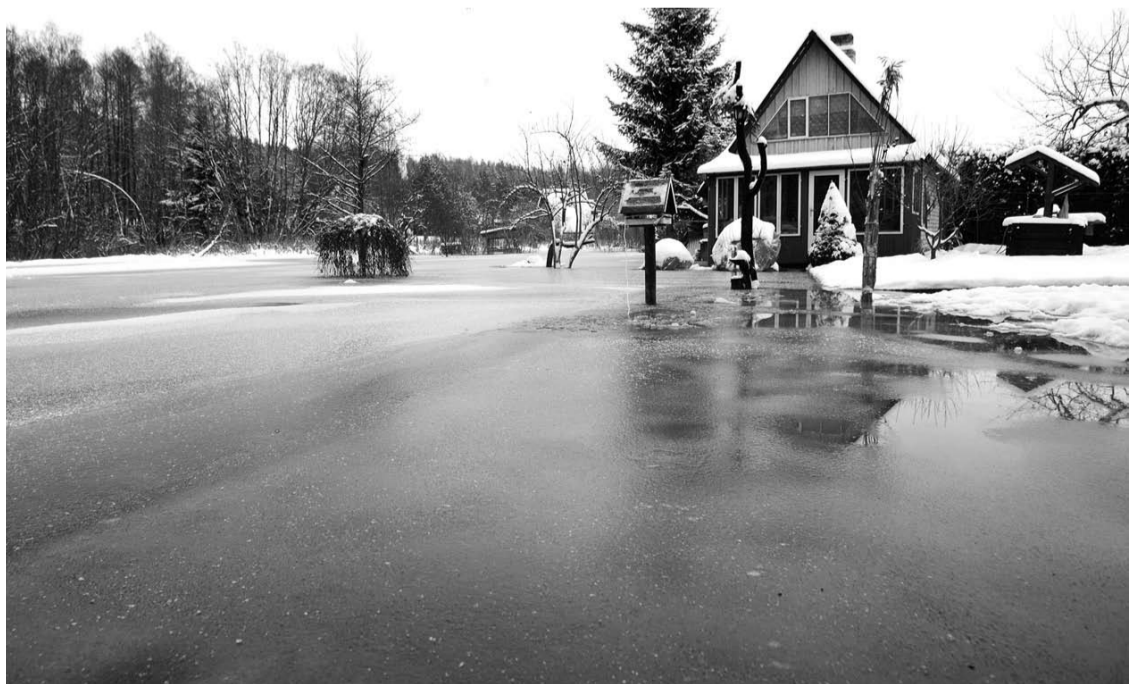
Trūko gal dešimties centimetrų, kad kai kurių „Elmos“ sodų namelių viduje teliuskuotų Šventosios vanduo.