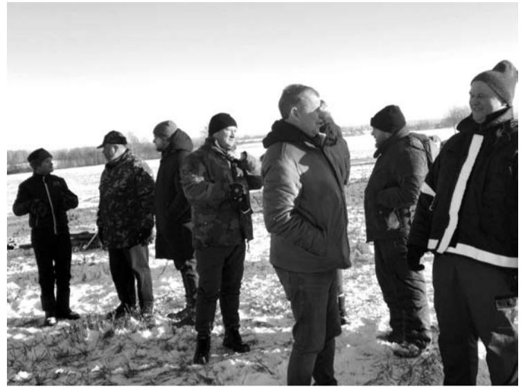
Ūkininkų negąsdino beveik 20 laipsnių šaltis.

ja, Švedija, Norvegija, Čekija, kur uždegti pavieniai laužai. Anykščių rajone buvo suplanuota uždegti keturis laužus, bet jų yra daugiau – laužus užkūrė ir pavieniai individualūs ūkiai šalia savo sodybų ar pagrindinių kelių. Iš viso Anykščių rajone turime devynis ar dešimt laužų“, – skaičiavo D. Arlauskas.