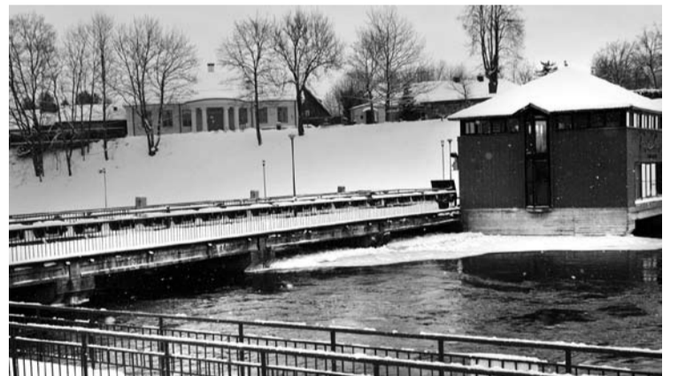
Vanduo abiejose užtvankos pusėse buvo susilyginęs. Šliuzai liko po vandeniu.